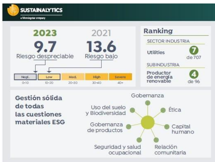
Tabla: Comparativa de resultados de Greenergy otorgada por Sustainalytics en 2023

Tras evaluar en detalle el comportamiento y el rendimiento de Greenergy en materias de medio ambiente, sociedad y gobernanza, Sustainalytics ha valorado positivamente los grandes esfuerzos por parte de la compañía para mejorar las relaciones con la comunidad, la inversión en capital humano, salud y seguridad en el trabajo, así como en sus políticas de gobernanza.