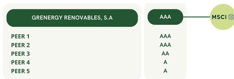
Tabla: Puntuación MSCI ESG obtenida por Greenergy en 2023 en comparación a sus peers

correspondientes al ejercicio anual terminado el 31 de diciembre de 2023